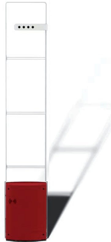
*With integrated visitor counting and red base covers

# Part Numbers 10117345 G35 PSB 10109368 use Classic Style SSB part number